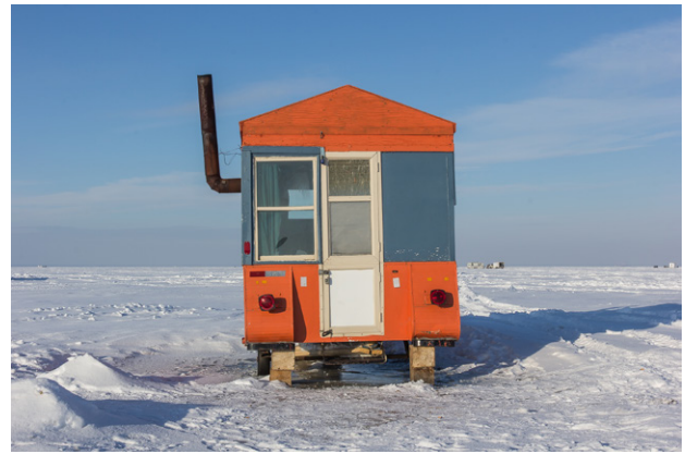
Baie-du-Febvre 2, 2012, Lac Saint-Pierre (fleuve Saint-Laurent)